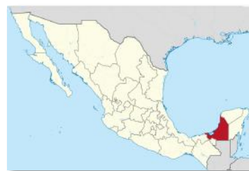
El Estado de Campeche, México